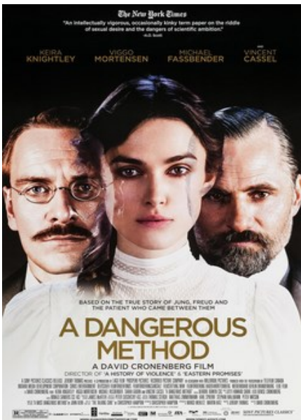
A Dangerous Method - film fra 2011 med bl.a. Viggo Mortensen, Keira Knightley og Michael Fassbinder. Instruktør: David Cronenberg

Oscar prisbelønnet filmklassiker, der fortæller om den vanskelige situation for far og datter, når faderen Anthony får diagnosen Alzheimers. En begavet mand, der lytter til opera, nyder klassisk musik og læser stor litteratur. Datteren Anne forsøger længst muligt at lade faderen være i sine vante omgivelser, men han skræmmer alle plejere væk, og på et tidspunkt må Anne træffe et svært valg.