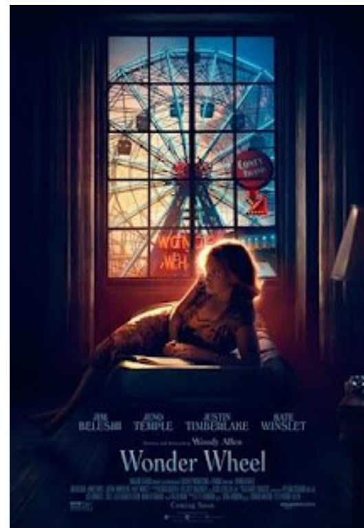
Wonder Wheel - film fra 2017 af Woody Allen med Kate Winslet, Jim Belushi, Juno Temple og Justin Timberlake.

To af verdens mest intelligente, men måske også mest kontroversielle mænd, Carl Jung og Sigmund Freud, har en intensiv og dog konfliktfyldt forbindelse, som leder frem til psykoanalysens fødsel. Den dybt forstyrrede, men intelligente kvinde Sabina giver anledning til uoverensstemmelse mellem de to lærde og veluddannede psykiatere.